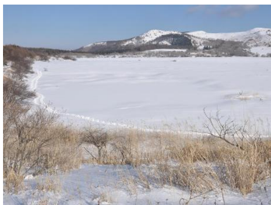
八島ヶ原湿原をスノーシューで歩いた跡