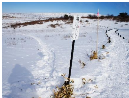
車山湿原をスノーシューで横断した跡