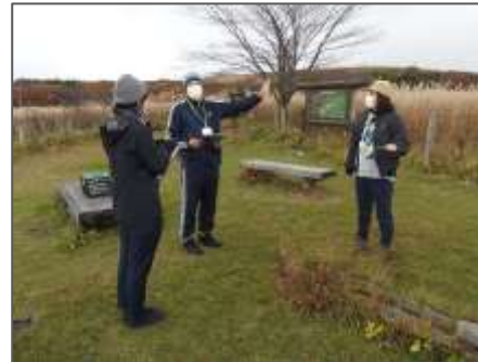
プログラム作成と発表