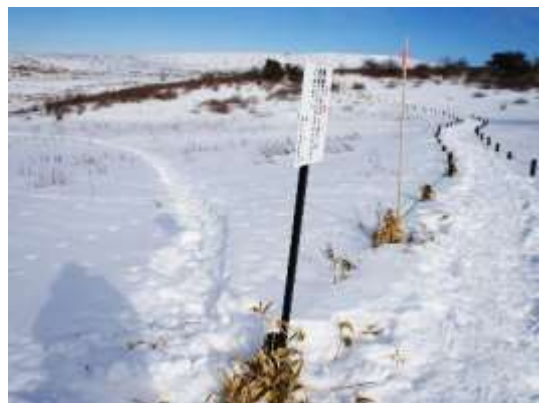
車山湿原をスノーシューで横断した跡