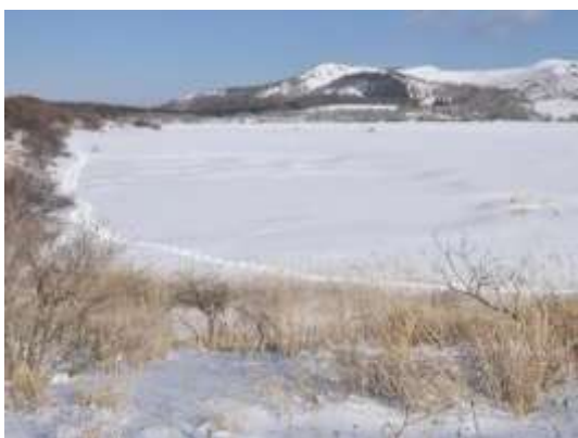
八島ヶ原湿原をスノーシューで歩いた跡